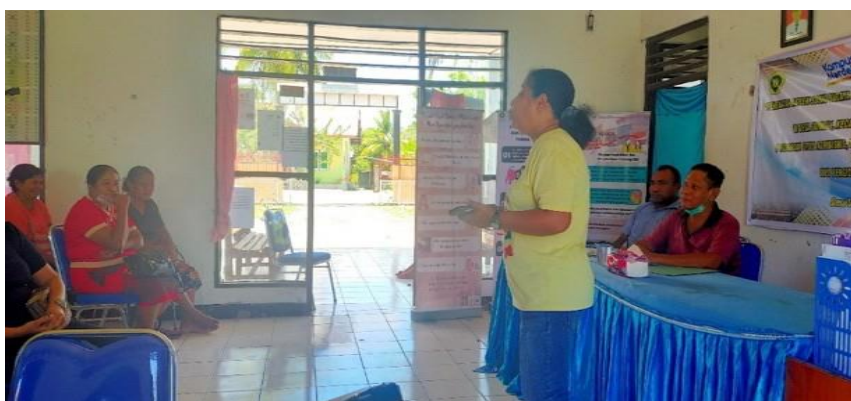
Gambar 1. Penyampaian Materi tentang Pengetahuan Gizi Seimbang

Penyuluhan dan Pelatihan Pemanfaatan Pangan Lokal Dalam Rangka Penerapan Gizi Seimbang di Desa Sumlili Kecamatan Kupang Barat, Kabupaten Kupang dilaksanakan pada Hari Sabtu, Tanggal Oktober 2022 di Desa Sumlili dan dihadiri oleh Staf Desa Ibu-Ibu PKK dan Ibu-Ibu Kader. Keseluruhan peserta Penyuluhan dan Pelatihan di luar Staf Desa berjumlah 25 orang. Acara kegiatan Penyuluhan dan Pelatihan Pemanfaatan Pangan Lokal Dalam Rangka Penerapan Gizi Seimbang di Desa Sumlili Kecamatan Kupang Barat, Kabupaten Kupang ini dibuka oleh Sekretaris Desa