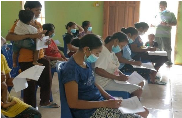
Gambar 3. Pelaksanaan Pre Test

responden dari sebelum mendengarkan paparan materi dengan pengetahuan responden setelah mendengarkan paparan yang disampaikan. Setelah direkap hasil pre test dan post test didapati hasil ada peningkatan pengetahuan dari 60% menjadi 80% berdasarkan item-item pertanyaan yang ditanyakan.