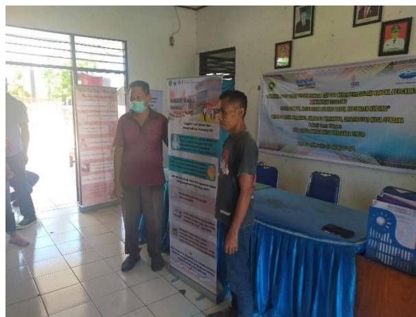
Gambar 5. Penutupan Kegiatan

Penutupan kegiatan Penyuluhan dan Pelatihan Pemanfaatan Pangan Lokal Dalam Rangka Penerapan Gizi Seimbang di Desa Sumlili Kecamatan Kupang Barat, Kabupaten Kupang ini dilakukan oleh Sekretaris Desa Sumlili dengan ditandai penyerahan alat bantu pengukuran Anthropometri untuk penentuan status Gizi kepada Ibu Ibu PKK dan Ibu Ibu Kader melalui Sekretaris Desa