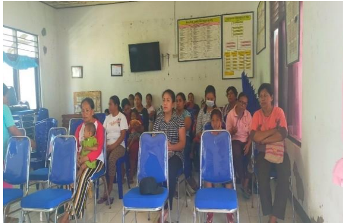
Gambar 2. Penyampaian Materi tentang Pengetahuan Gizi Seimbang