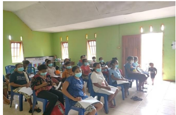
Gambar 4. Pelaksanaan Post Test

Penutupan kegiatan Penyuluhan dan Pelatihan Pemanfaatan Pangan Lokal Dalam Rangka Penerapan Gizi Seimbang di Desa Sumlili Kecamatan Kupang Barat, Kabupaten Kupang ini dilakukan oleh Sekretaris Desa Sumlili dengan ditandai penyerahan alat bantu pengukuran Anthropometri untuk penentuan status Gizi kepada Ibu Ibu PKK dan Ibu Ibu Kader melalui Sekretaris Desa